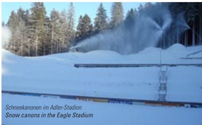
Schneekanonen im Adler-Stadion Snow canons in the Eagle Stadium